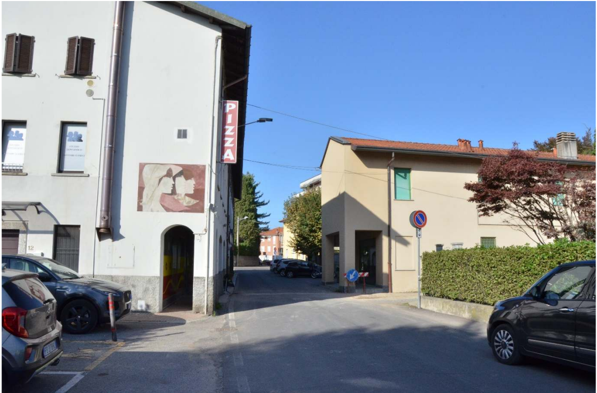
Vista Via C. Cantù