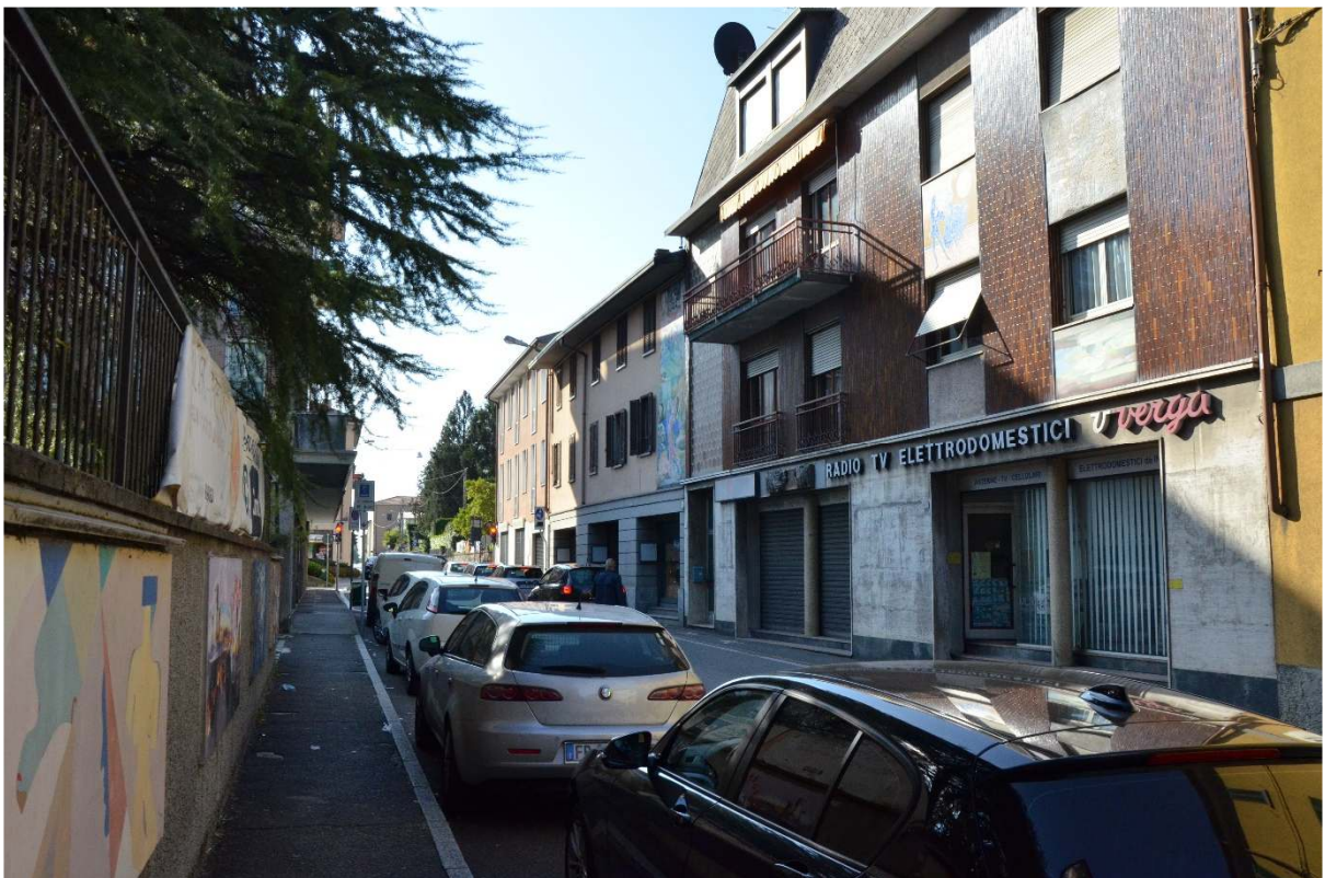
Via G. Mameli