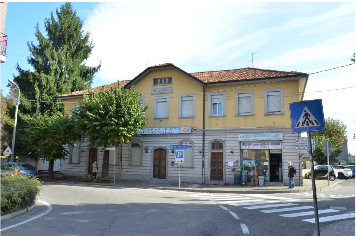
Incrocio Via C. Cantù – Via G. Garibaldi – Casa del Popolo