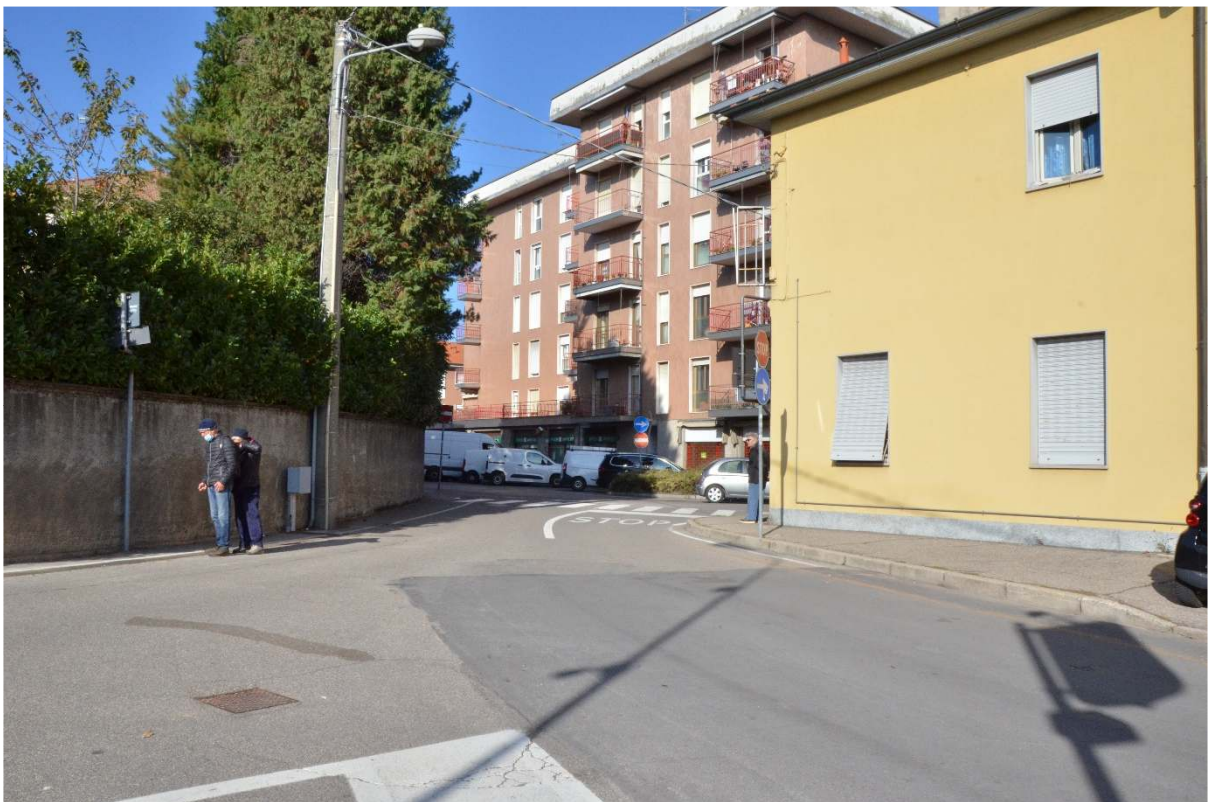
Incrocio Via C. Cantù – Cond. C. Cantù