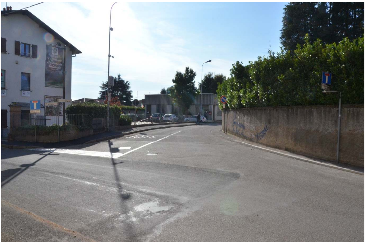
Incrocio Via C. Cantù – Via Parini