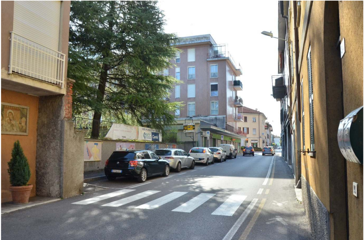
Via G. Mameli