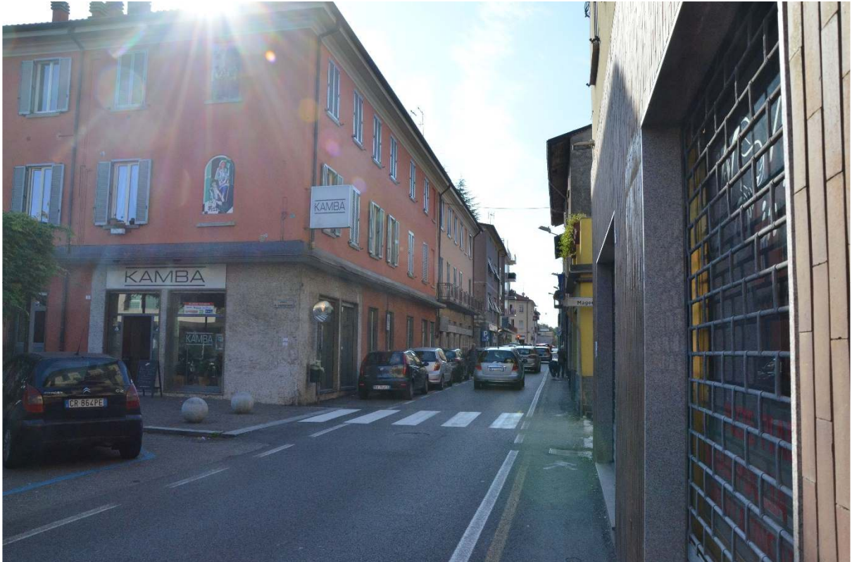
Via G. Mameli