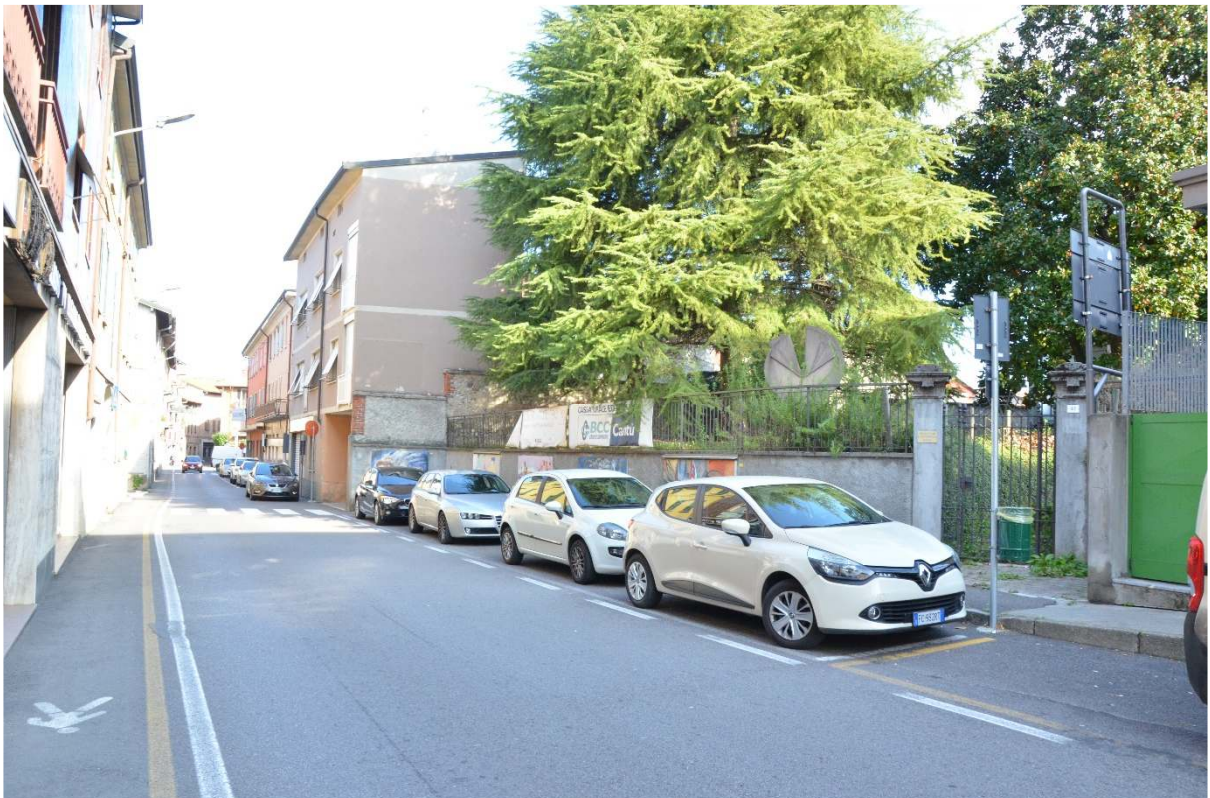
Via G. Mameli – area Villa