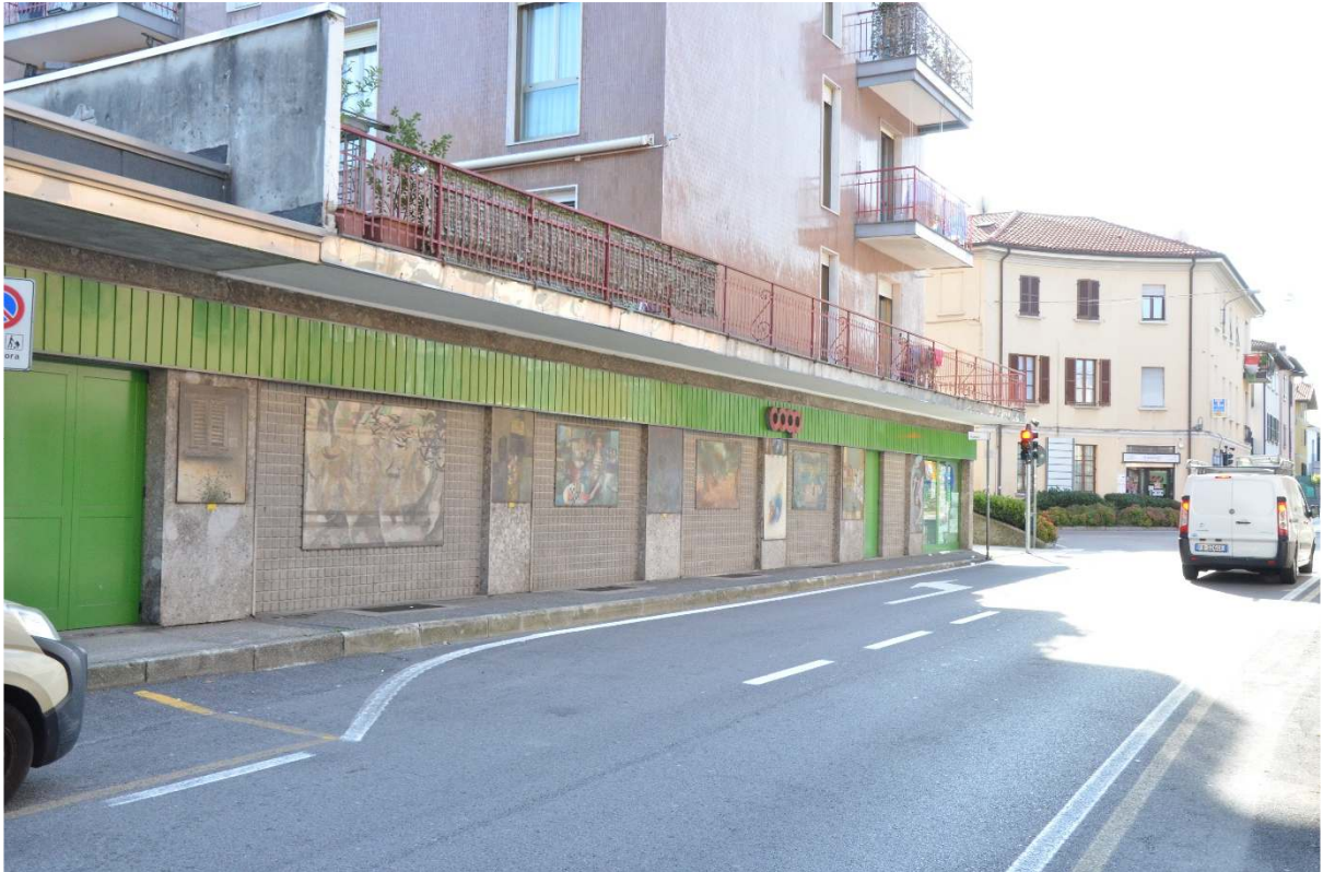
Via G. Mameli – negozio Coop Consumo