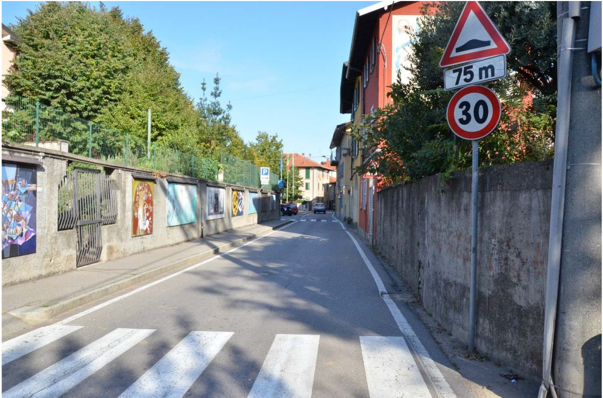
Via G. Garibaldi