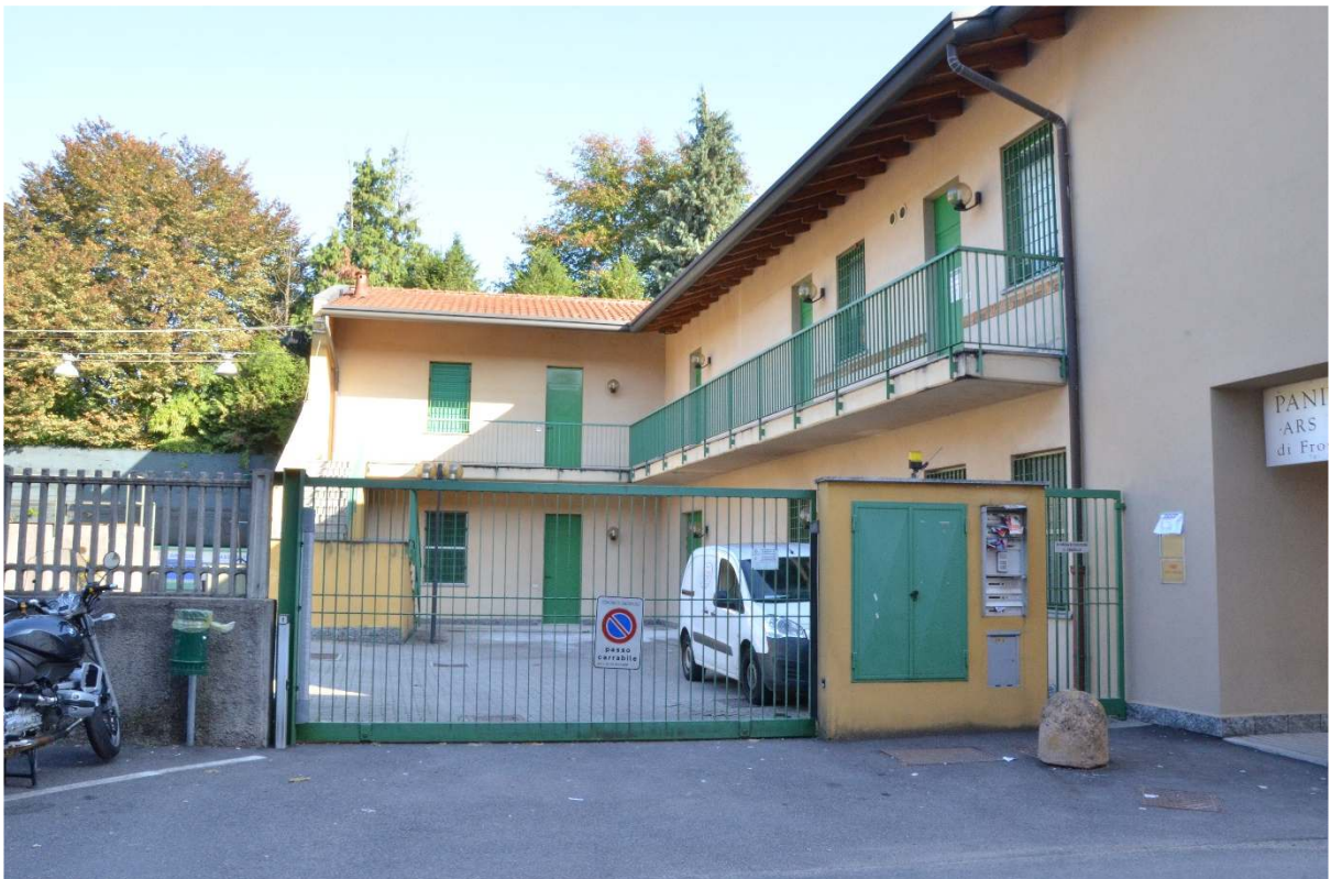
Via C. Cantù – Propr. Coop Consumo