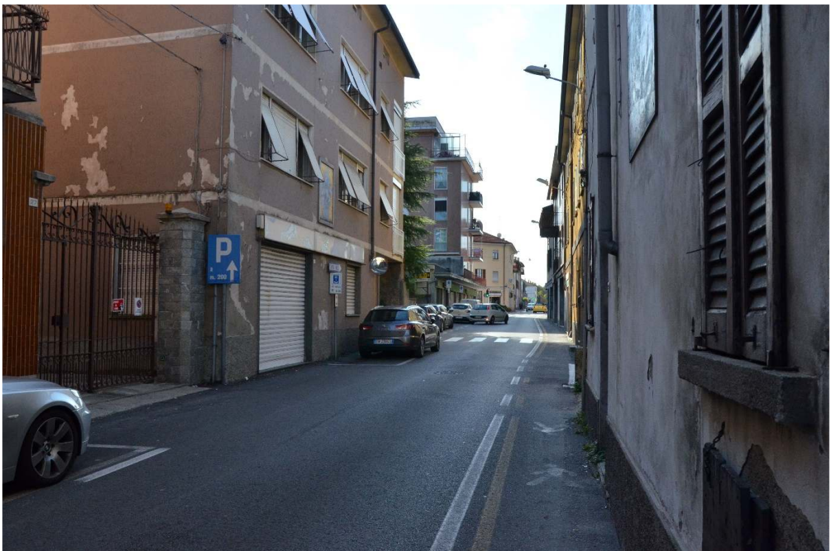
Via G. Mameli – Casa ex Verga