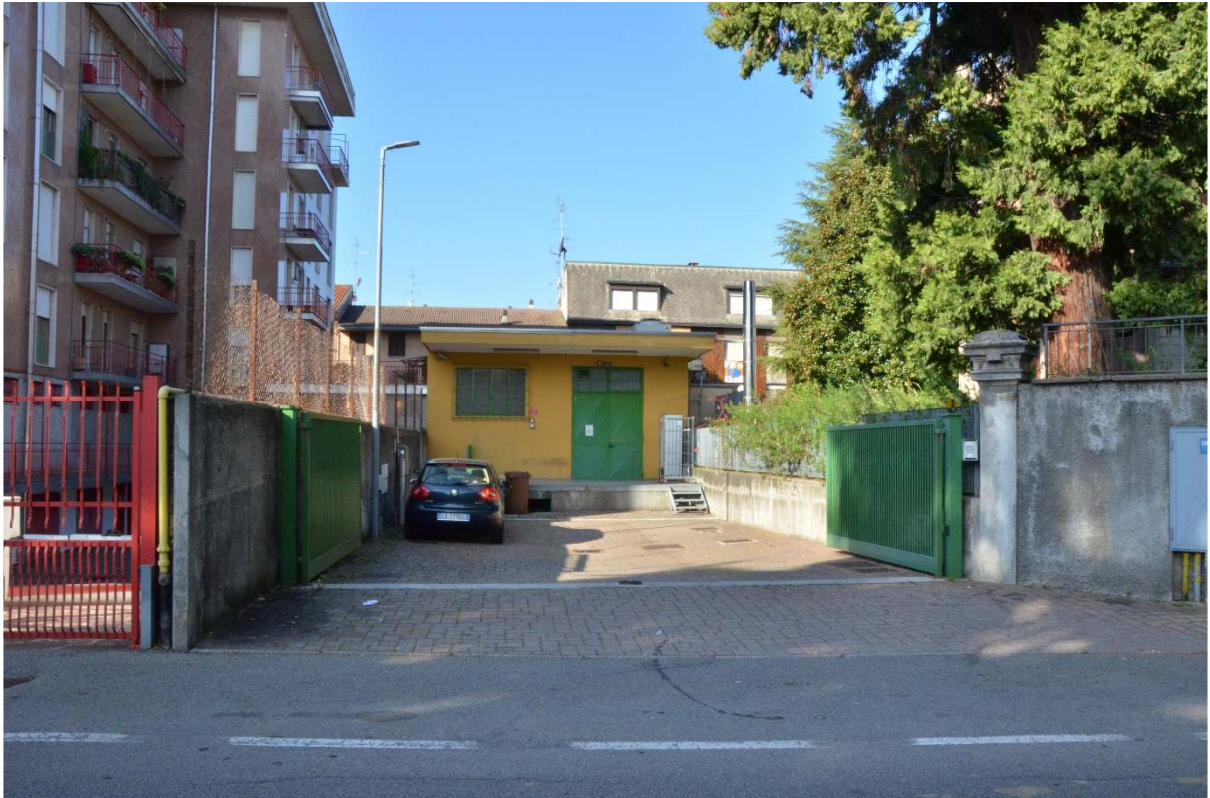
Ingresso magazzino carico/scarico Coop Consumo – Via G. Garibaldi