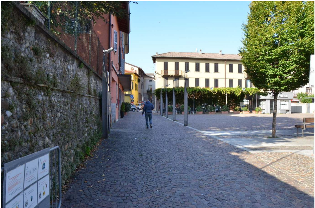
P.zza Elio Zampiero