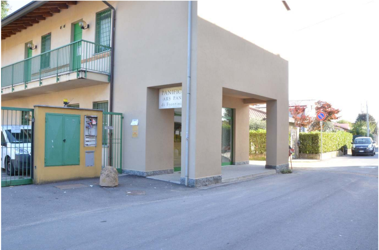
Via C. Cantù – Propr. Coop Consumo