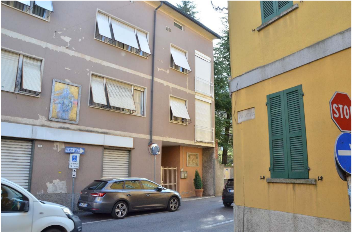
Via G. Mameli - Casa Ex Verga