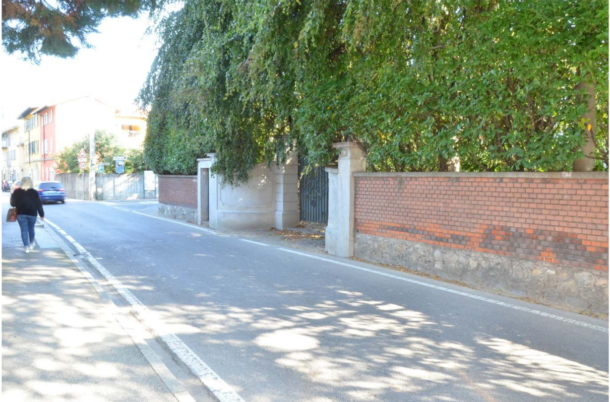
Via G. Garibaldi