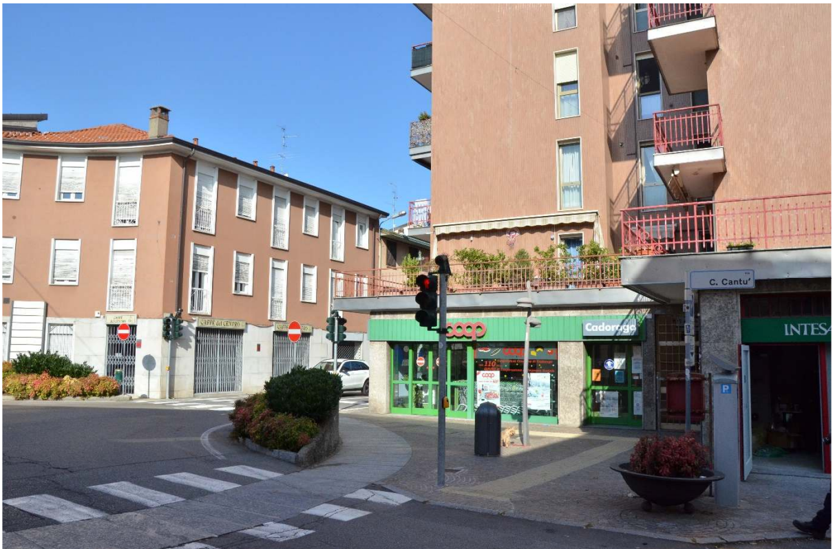
Ing. negozio Coop esistente