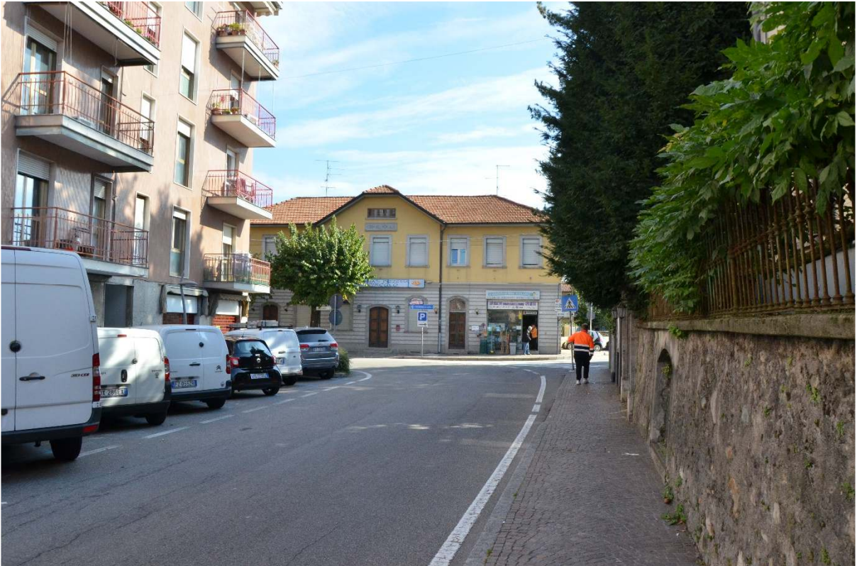
Via C. Cantù – Casa del Popolo