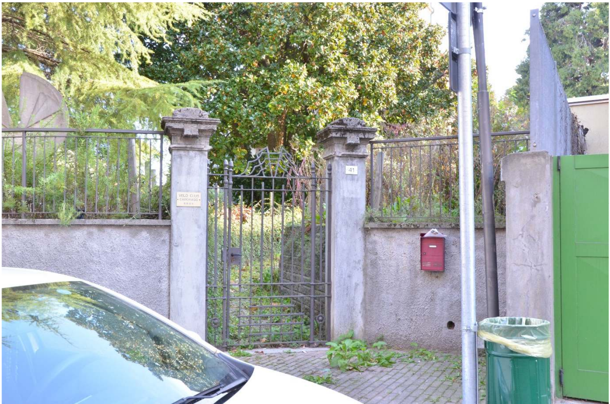
Via G. Mameli – ing. pedonale villa