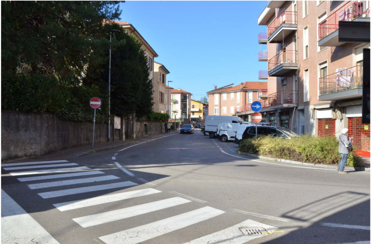
Via C. Cantù