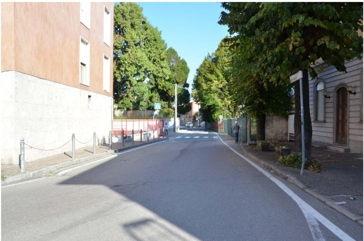
Via G. Garibaldi