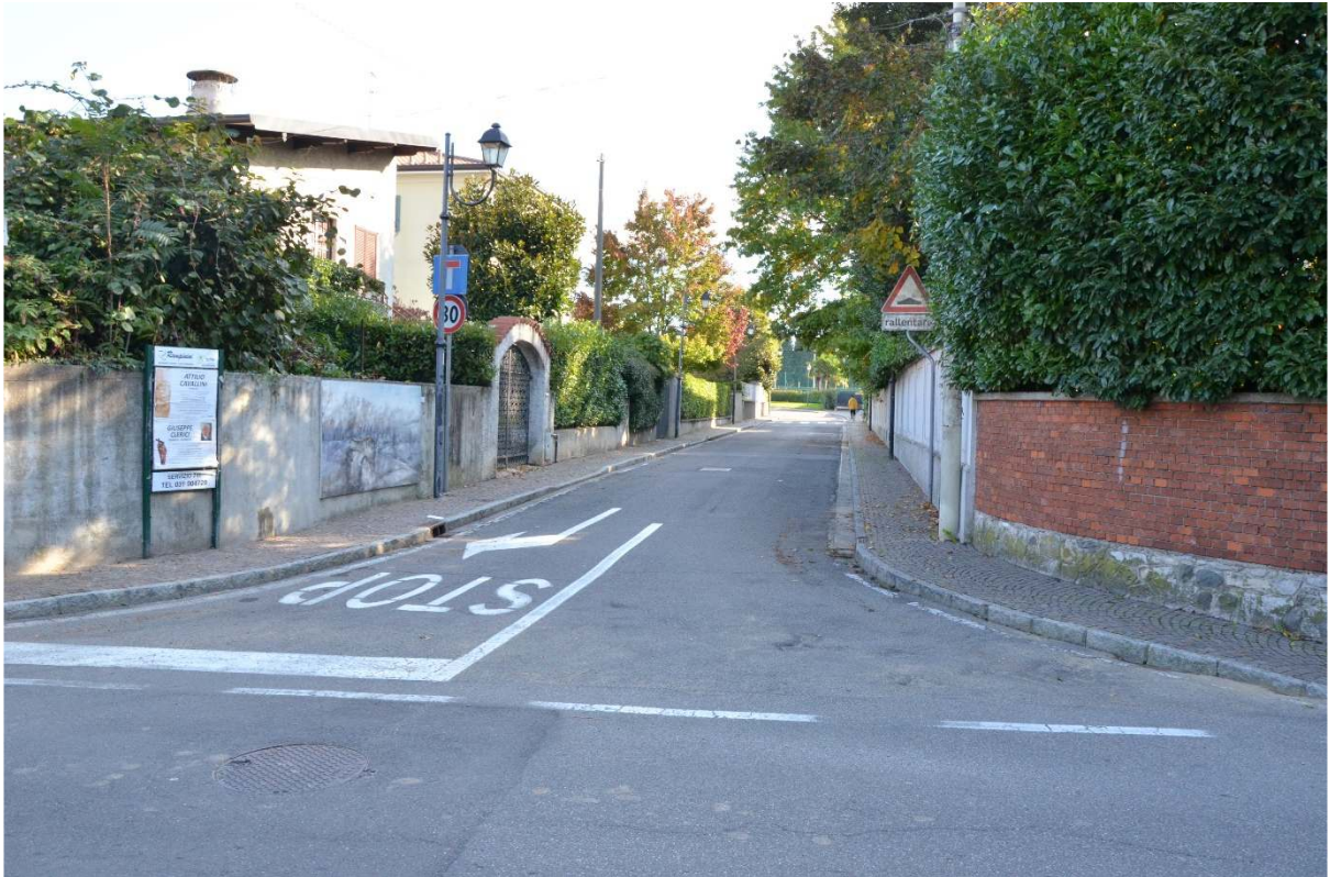
Via Papa Giovanni XXIII