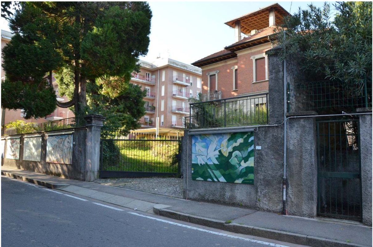
Via G. Garibaldi