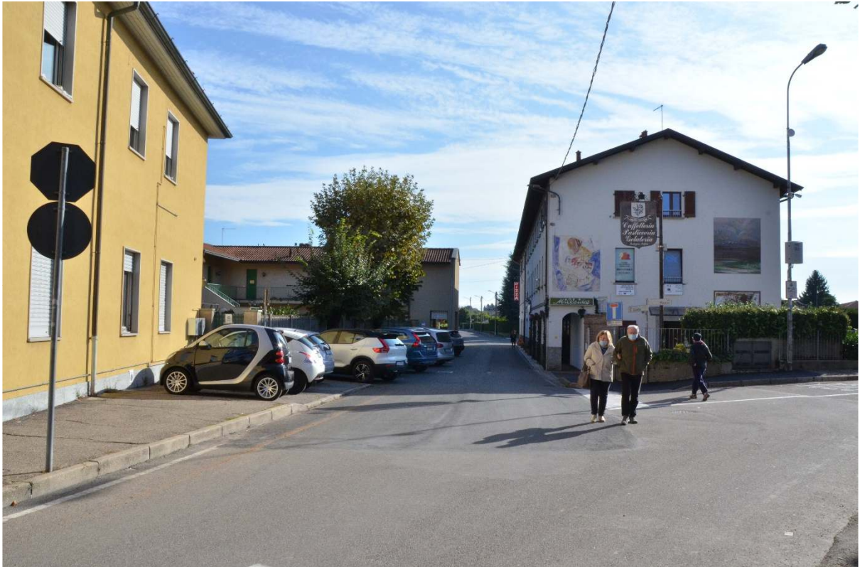
Via C. Cantù