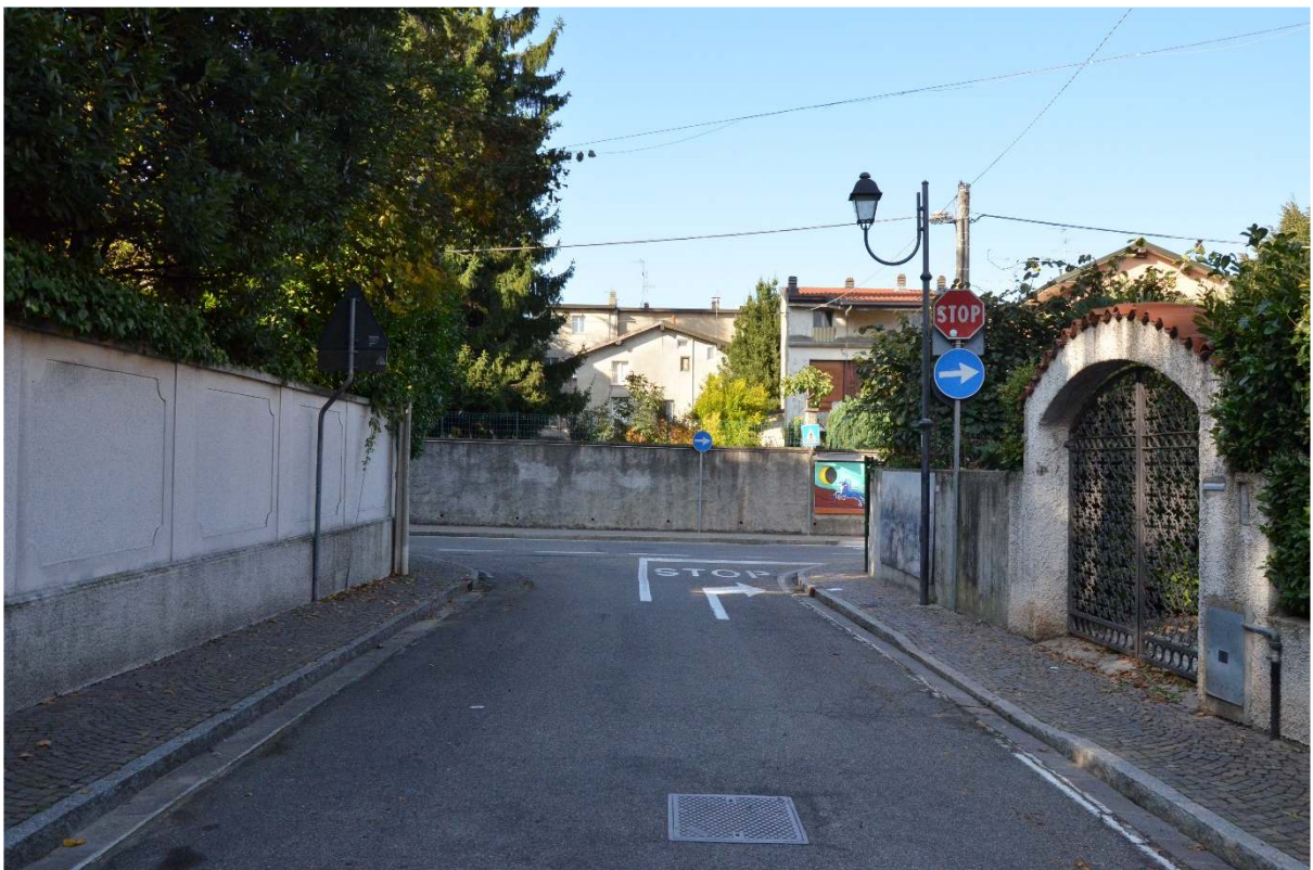
Incrocio Via Papa Giovanni XXIII – Via G. Garibaldi