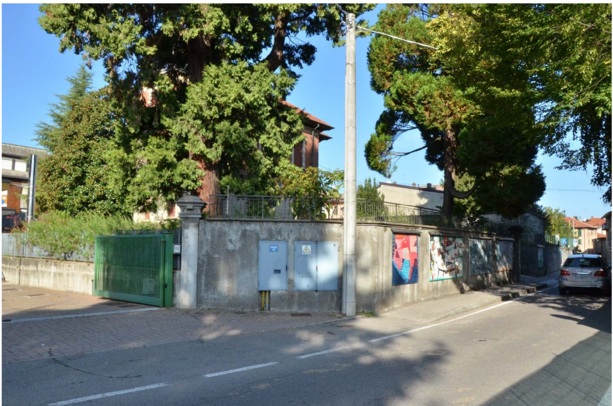
Via G. Garibaldi – Villa