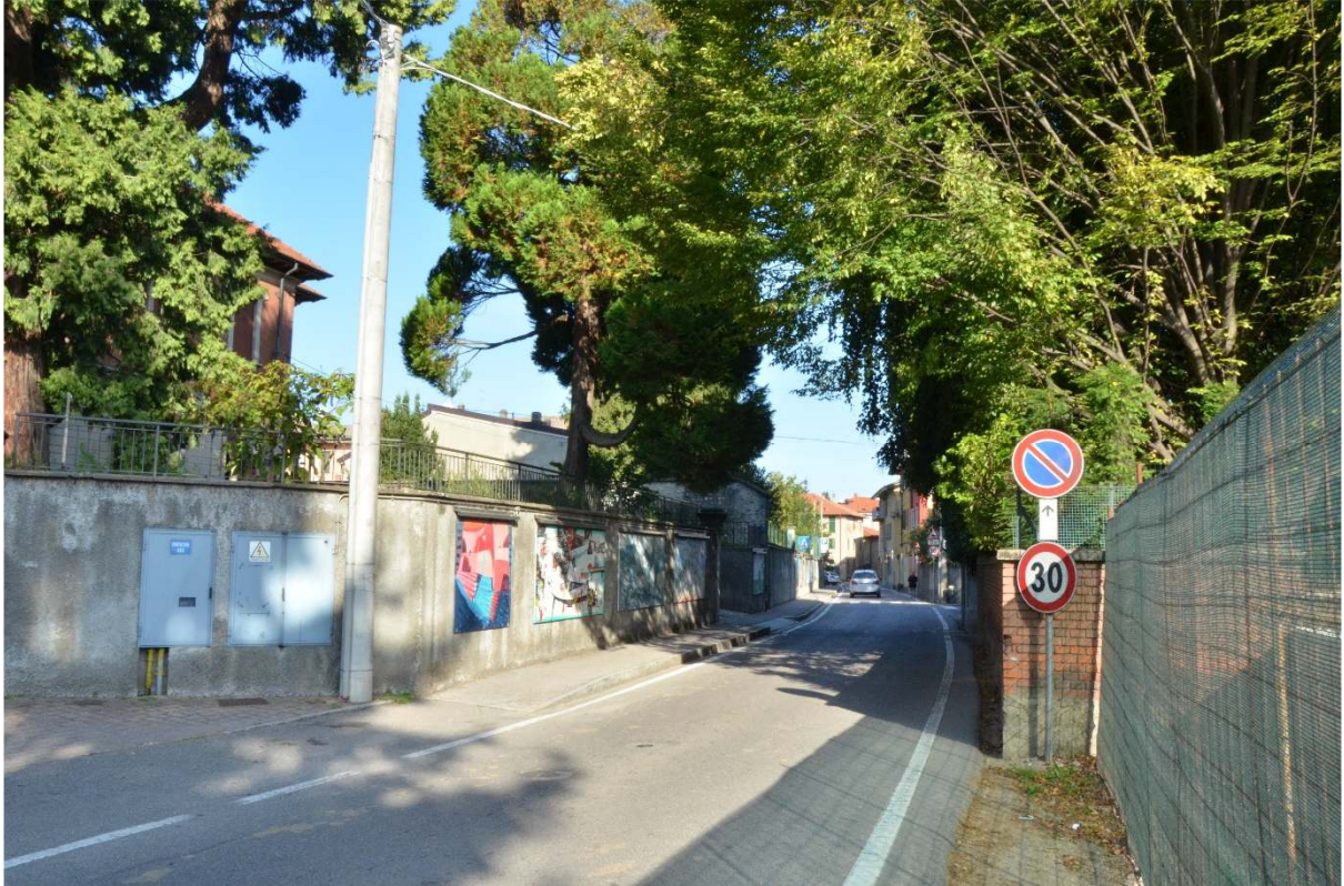
Via G. Garibaldi